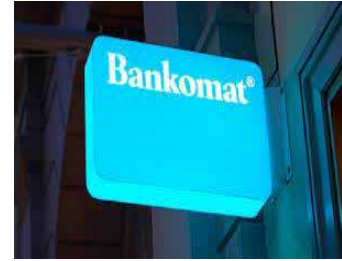
Får de finnas kvar?