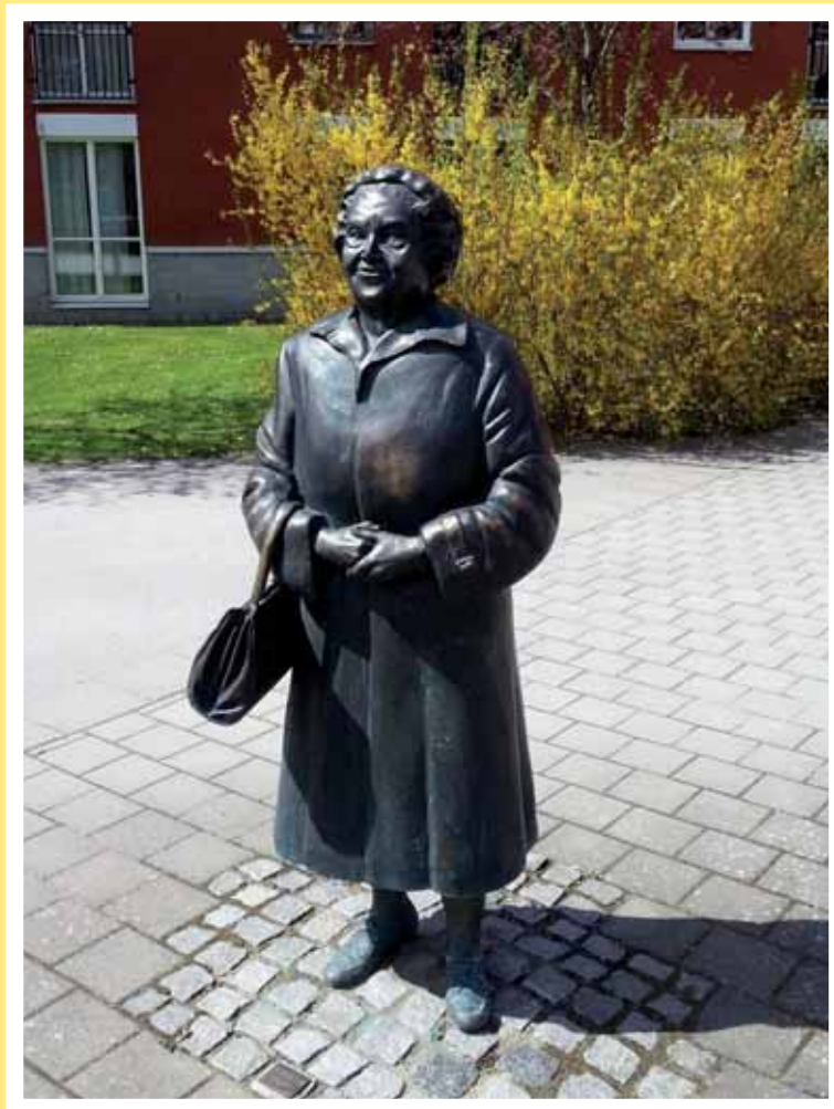
Den svenska tanten