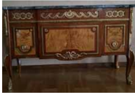
1700-tal - gustavianskt