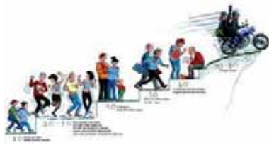
Vår tids ålderstrappa