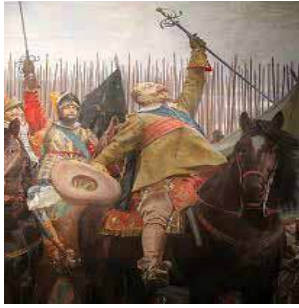
1600-tal - krig