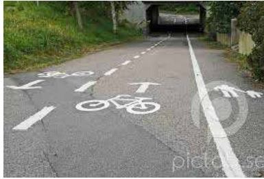
Växjö – en framtidsvision