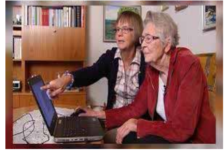
1900-tal - på skolbänken igen